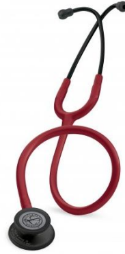
5868 - Bordeaux édition black 98 €