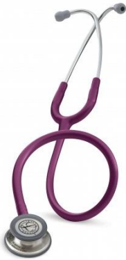
5831 - Prune 93 €