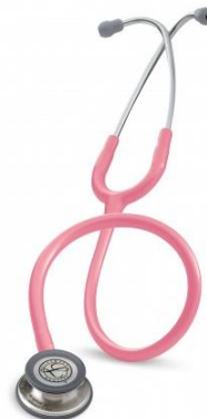
5633 - Rose nacré 93 €