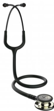
5861 – Noir édition champagne 98 €