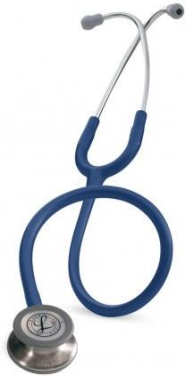
5622 - Bleu marine 93 €