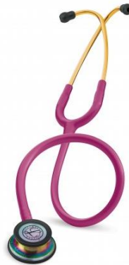
5806 - Framboise édition rainbow 98 €