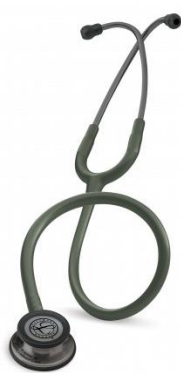
5812 – Vert olive édition smoke 98 €