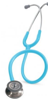
5835 - Turquoise 93 €