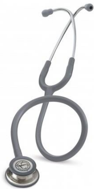
5621 - Gris 93 €