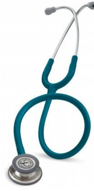
5623 - Bleu caraïbes 93 €