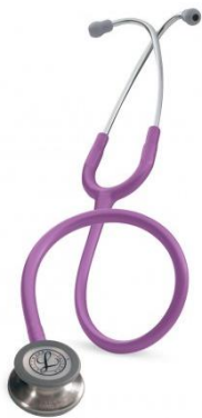
5832 - Lavande 93 €