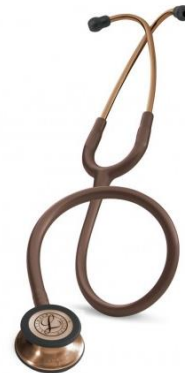
5809 - Chocolat édition copper 98 €