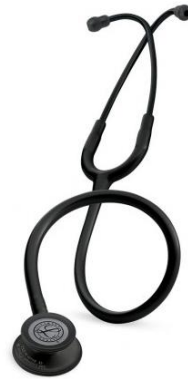
5803 – Noir édition black 98 €