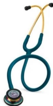
5807 - Bleu caraïbes édition rainbow 98 €