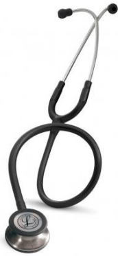
5620 - Noir 93 €