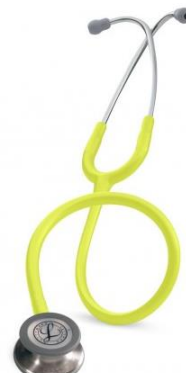
5839 – Jaune citron 93 €