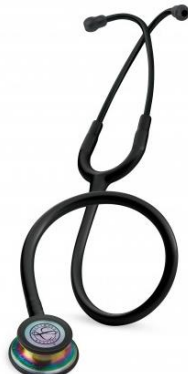
5870 - Noir édition rainbow 98 €