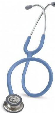
5630 - Bleu ciel 93 €