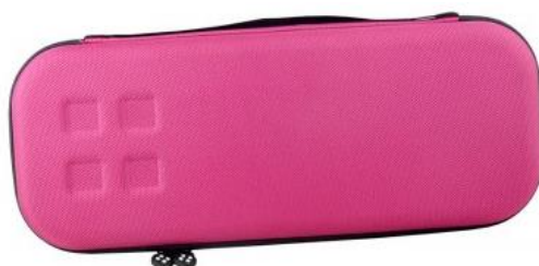
4 - Rose 25 €