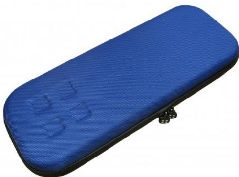
2 - Bleu royal 25 €