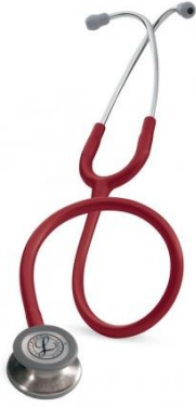
5627 - Bordeaux 93 €