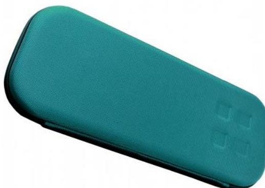
3 - Bleu caraïbes 25 €